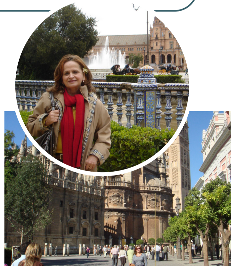
A principal característica de Sevilla, além de sua forte influência árabe, é ser uma cidade onde se tem vida na calle (rua)!